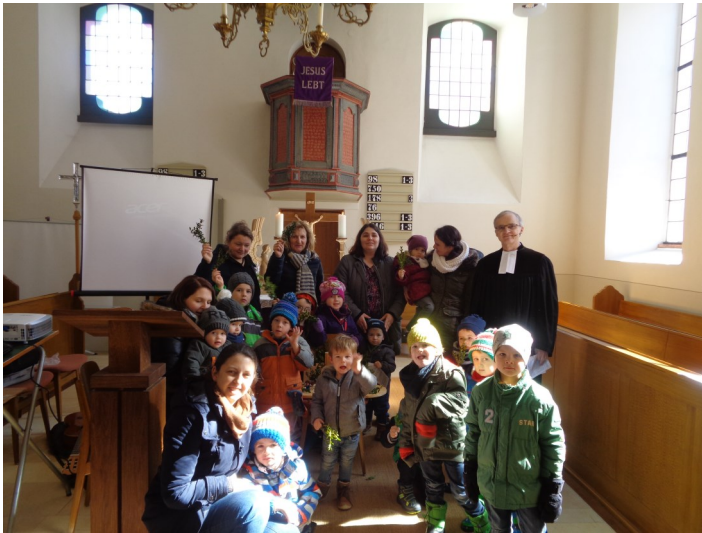
Foto: Minigottesdienst in der Friedenskirche in Munningen